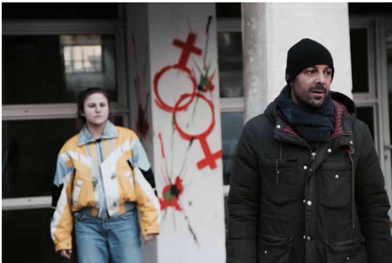
Sortie de résidence - Lycée agricole de la Condamine à Pézenas janvier 2020 - Le père et sa fille, jeune lycéenne

Notre propos consiste à tendre, dramatiquement et au sens de mettre en tension, un lien entre le recto et le verso, pour les confronter, les mettre en regard et en écho, interroger aussi la fiction du langage qui « promet », « légalise » ou « expulse », et la notion de « communication », d'acte « militant », de « mobilisation », de « manifestation ». la rue sera la ligne de fuite, au sens littéral et figuré, la mise en perspective de ces 2 espaces contradictoires mais existants tous deux.